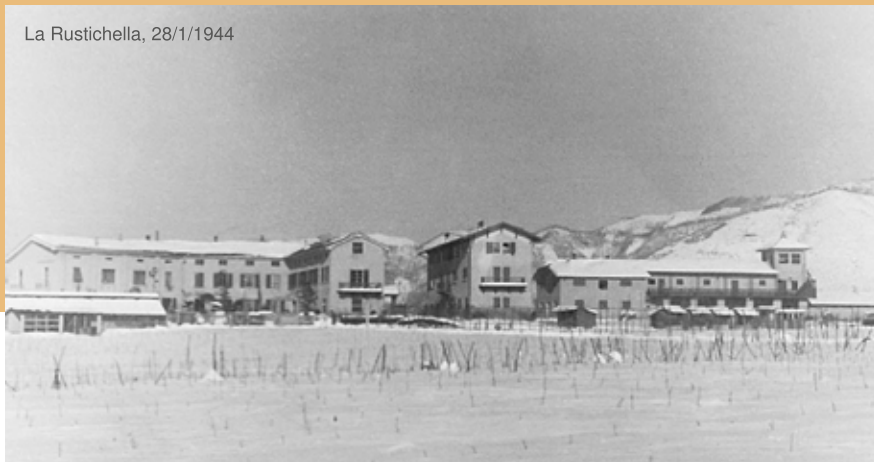
La Rustichella, 28/1/1944

La celebrazione si svolgerà mercoledì 24 aprile , con ritrovo in Municipio alle ore 9.30 , da cui avrà inizio la commemorazione, che proseguirà al parco Leto di Priolo. ■