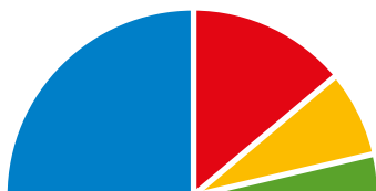
Camera dei Deputati

Lega, Forza Italia, Fratelli d'Italia, Noi con l'Italia 2.145 voti / 50,16%