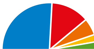
Camera dei Deputati

Lega, Forza Italia, Fratelli d'Italia, Noi moderati 2.078 voti / 52,05%