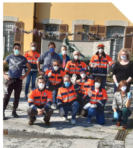
Volontari e Giunta comunale

Per tutti i servizi non essenziali abbiamo attivato la modalità di lavoro agile (da casa) e alternato la presenza dei dipendenti in ufficio.